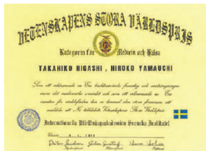
2010년 Swedish Medical Academy Awards 에서 바이오매트는 세계 각국의 의료기기와 경쟁하여 의료기 부문 대상을 수상하였습니다.

미국 FDA로부터 510K 승인을 받고, 일본 후생노동성으로부터 의료기기 승인을 받은 후 세계에서 가장 권위있는 경제 신문인 월스트리트 저널로부터 2006년 최고로 건설한 기업중의 하나로 인정 받아, 미국의 부시 대통령으로부터 표창을 받았습니다. 일본 리치웨이 지사는 일본 문화진흥원의 후시미 왕자로부터 일본인의 건강에 기여한 공로를 인정받아 표창을 받았습니다. 또한 스웨덴 왕립 아카데미 의료기 부문 대상을 받아 사람들의 건강과 삶의 질을 높이는 데 힘쓰고 있습니다.